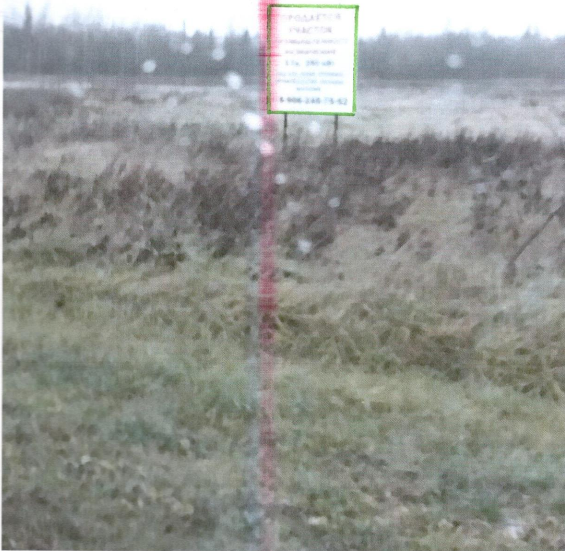
Ленинградская область, Волховский муниципальный район, Кисельнинское сельское поселение